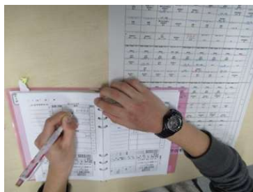
スケジュール管理の対応法

メモの取り方、スケジュール管理、ミスを減らす方法やリラクゼーション法など、自分にあった対応法を学べます。