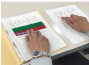
ケアレスミス防止の対応法

メモの取り方、スケジュール管理、ミスを減らす方法やリラクゼーション法など、自分にあった対応法を学べます。