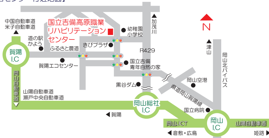
【当センター付近地図】